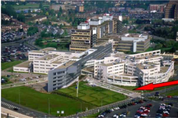
Hôpital Jeanne de Flandre Entrée par la Maternité